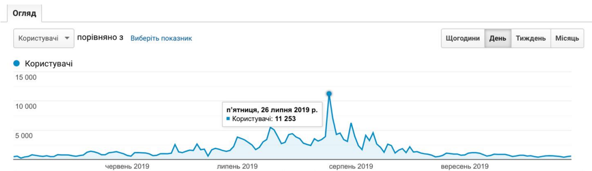
Рисунок 3. Графік відвідувань сайту Приймальної комісії Кपी ім. Ігоря Сікорського (01.05.2019 – 30.09.2019)

Основні відвідування припали на переддень оголошення результатів надання рекомендації за широким конкурсом на базі ПЗСО – 26 липня 2019 року сайт одночасно відвідали 11253 користувачів. Середній показник унікальних відвідувачів на день становив понад 4 тисячі користувачів впродовж всього активного періоду вступної кампанії (рис. 3):