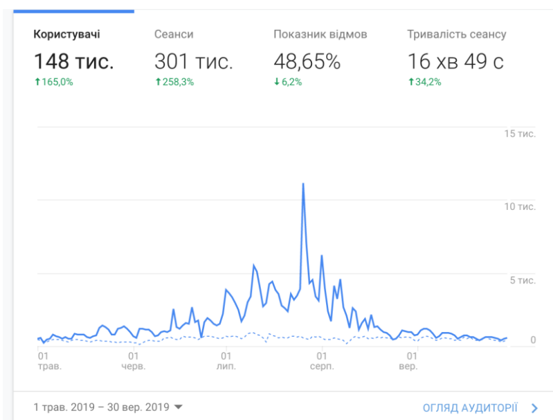
Рисунок 1. Основні метрики сайту Приймальної комісії КПІ ім. Ігоря Сікорського (01.05.2019 – 30.09.2019)

Для аналізу було взято активний період вступної кампанії 2019 року (1 травня 2019 року – 30 вересня 2019 року). За цей період, відповідно до даних Google Analytics [3], сайт Приймальної комісії КПІ ім. Ігоря Сікорського відвідали 148 тис. користувачів із середнім активним сеансом перебування на сайті понад 16 хвилин, що свідчить про велику зацікавленість в інформації. Основні метрики за період наведені на рис. 1: